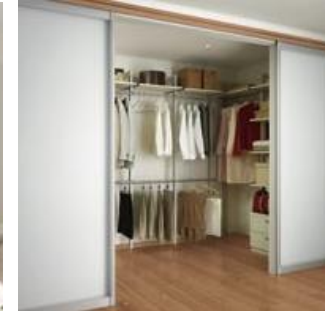
ウォークインプラン