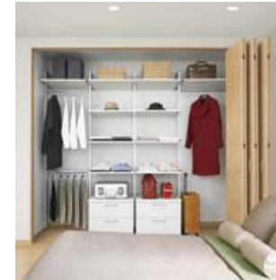
クローゼットプラン