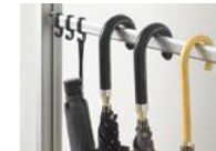
小物掛けパイプセット