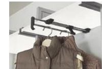
スライドパイプセット