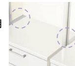
引出し隙間カバー