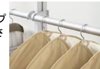
ハンガーパイプセット

ハンガーパイプセットと小物掛けパイプセットをご用意。プランに合わせて高さを調整できます。前後に可動するスライドパイプもあります。