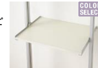
フレーム／棚板セット

フレームとフレームの間には、必ず棚板をご使用ください。パーツは強度上最低、フレーム2本、棚板1セットが必要となります。棚板は1枚入りと3枚入りをご用意しています。