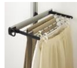
ズボン・スカート掛け